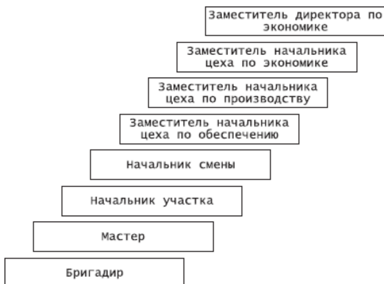
Рис. 2. Карьера менеджера: вариант Б