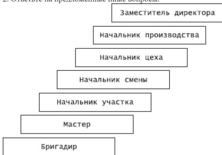
Рис. 1. Карьера менеджера: вариант А